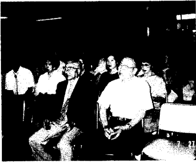
岩見沢市の緑成園で園長の説明を聞く民生委員の一行

一人暮らしの老人 所帯への除雪奉仕 一人暮らしのお年寄りや、身体の不自由な方々に対し、在宅福祉サービスの一環として除雪奉仕を行うため民生委員が調査し、町内会連合会(総括)、単位町内会と協力しあつて除雪奉仕活動を行い、この活動を通じて明るく住み良い地域社会づくりに進めると共に、温い心のふれあいと連帯感を生みだすよう努めております。