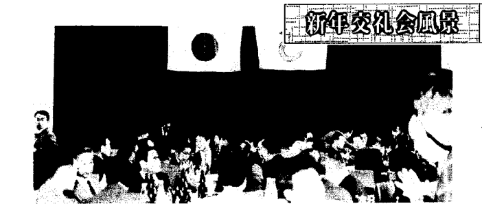
新年交礼会風景 昭和63年の新年交礼会は、1月10日多数の来賓を迎え、各町内会より約200名が出席、懇親の実を挙げ盛會裡に行われた。なお、昨年完成した「清田音頭」が地区婦人部の踊りで初披露された。

郷土館の名称が変わり 見学者が増えつつあります 清田地区郷土館は、先人の労苦を偲び、その功績を讃えると共に、開拓の歴史を後世に永く伝えるために設置されたものですが、地域発展の中で、とくく 忘却されてゆく昔のこの地区の統一的名稱「あしりべつ」を冠して、あしりべつ郷土館と称することを運営委員会で決議されて名称変更しました。 なお、皆様ご家族のご観覧、小中学校生のご見学が年々増加しており厚くお礼申し上げます。