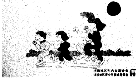
清田地区青少年育成委員会 制作ポスター