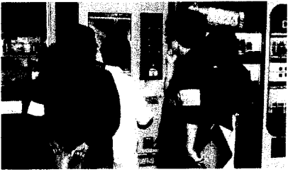
6月10日、有害図書追放で図書の自動販売機撤去を依頼する育成委員たち