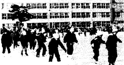
1月31日、好天に恵まれた子供スケート大会

「冬を楽しむ豊平区民の集い」の一つとして毎年行われている町連主催の「子供スケート大会」は、今年は1月31日晴天に恵まれ、豊平区長出席の下に行われました。大会には500人の子供が参加、寒さを吹き飛ばしてゲームを楽しみ、終わって恒例の「甘酒サーブ」に舌づつみをうちました。