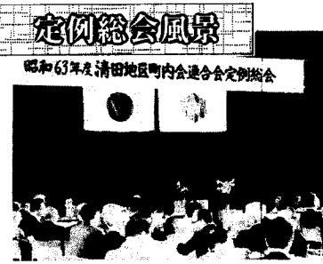
昭和63年度清田地区町内会連合会定例総会 4月24日開催の昭和63年度定例総会は、各町内会代議員180名が出席、提案事項は慎重かつ活発な討議の後、満場一致原案が可決承認され、役員改選が行われた。

私は清田地区が、皆様のご理解とご協力に満ちた街づくりのため全力を尽して取りくむ決意です。地域の