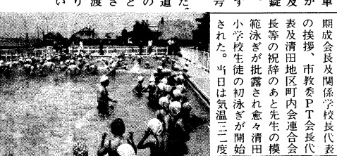
写真説明 左下) 清田地区の少土レ

た盗まれないよう心掛けて欲しい。盗んだ自動車は他の犯罪に使うことになり、他に迷惑を及ぼさないことからも施錠を完全にしたい。また、防犯措置(例えば戸を開けたらプザーが鳴る方法)を考えて欲しい。方法等を大切ですが、お互え住民の方の家近くに不審な者を見た、注意しよう。また、警察にその旨通報と申しましょうか。心構えがより効果的な防犯と思ふ。二、自動車も増え、必ず返して指導されるようお願いします。