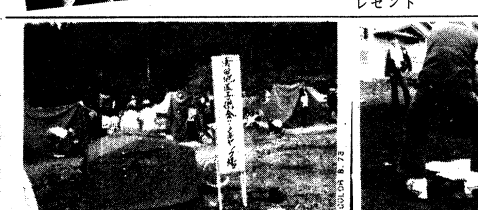
写真説明 左下) 清田地区の少土レ

印章登録は、S1生が、ま滅しているものおよび印刷のはっきりしない印章は照合が困難なので受