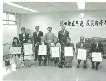
6月 役員研修会・表彰