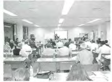
8月 防災・防犯講習会