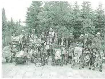
7月 こがもちゃんバス遠足