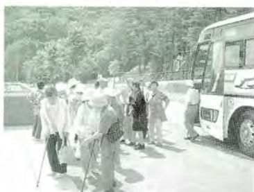
7月 ふれあいバスツアー