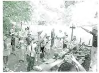
8月 ふれあいの森親子レク