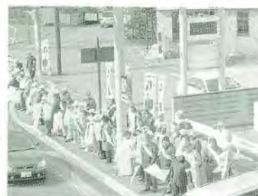
4月 春の交通安全街頭啓発