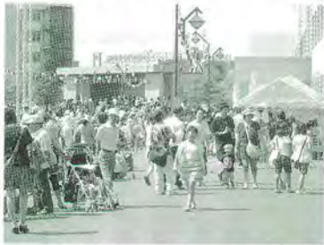
7月 ふれあい区民まつり