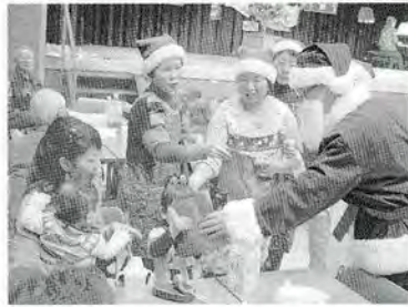
12月 福まちお楽しみ会