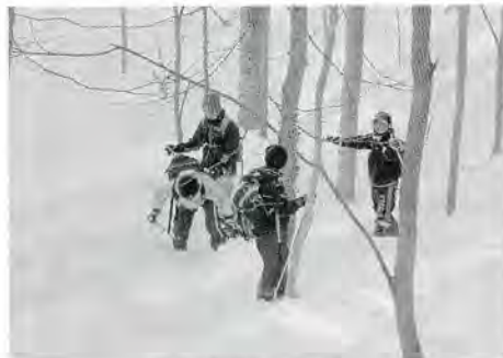
樹間スキーツアー

護者・地域と一体的な歩みで、有明の精神と粘り強さを確実に受け継ぎ、未来を見据えた教育実践を進めております。こうした教育実践は、開校以来、一貫して流れている「子どもに豊かな教育を」と願う地域・保護者の学校に対する熱い思いに支えられています。