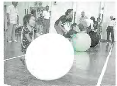
9月 こがもちゃんミニオリンピック