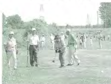
7月 パークゴルフ大会