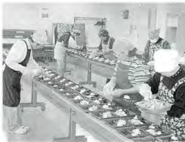
11月 福まち友愛訪問