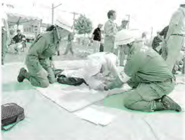
8月 清田区防災訓練