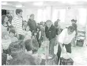
12月 親子もちつき大会