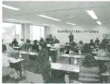
H21. 5. 15 福まち総会