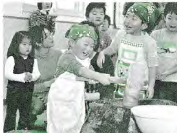
H21.12.13 親子もちつきレクリエーション