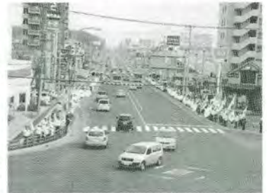
H21.9.30 秋の交通安全街頭啓発