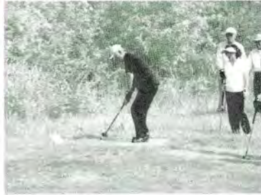
H21.6.28 町連パークゴルフ大会