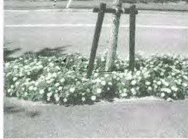
H21.9.9 まちづくり協議会花壇の様子