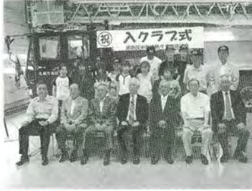
H21.6.27 少年消防クラブ 入クラブ式