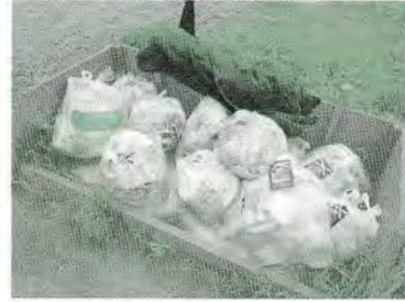
H21. 7. 2 ゴミ有料化による早期指導啓発