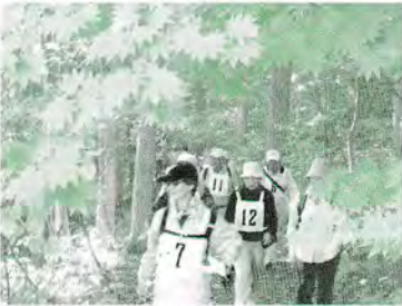
H21. 9. 27 第34回歩く運動