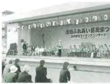
H21. 7. 18 清田ふれあい夏祭り