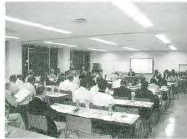
H21. 9. 15 防災・防犯部講習会