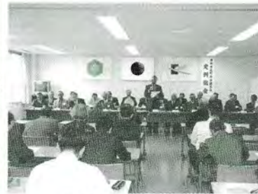
H21. 4. 18 町連総会