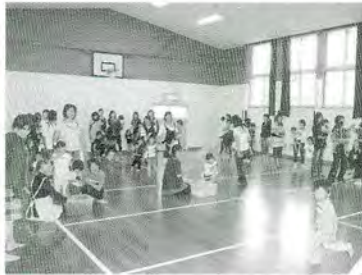
H21. 9. 17 こがもちゃんミニオリンピック