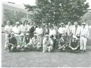
H21.9.6 不法投棄合同巡回パトロール