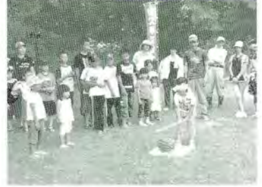
H21.8.4 ふれあいの森親子レク