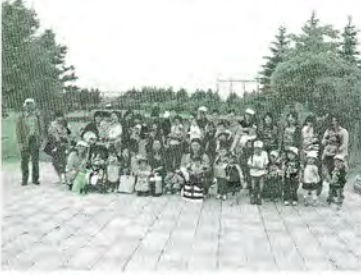
H21. 7. 21 こがもちゃんパス遠足