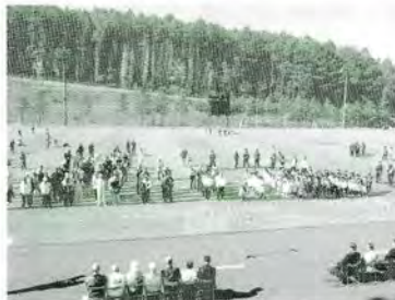
H21.10.10 白旗山フェスティバル