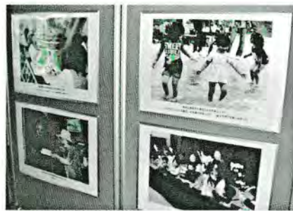
ロビーに展示の受賞作品

福まち推進センターは、お互いに支え合い、地域福祉の一層の推進と、人に優しいまちづくりを目標として活動しています。