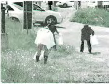
H21. 5. 29 ゴミゼロ街頭啓発