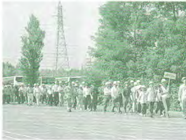
H17.9.1 札幌市総合防災訓練(イオン札幌平岡店)