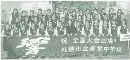
祝 全国大会出場!! 札幌市立真栄中学校