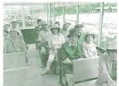
H17.7.22 福まちバス小旅行(百合が原公園)