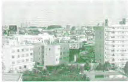
真栄1条1丁目付近と昭和36年当時の同所の田植え風景