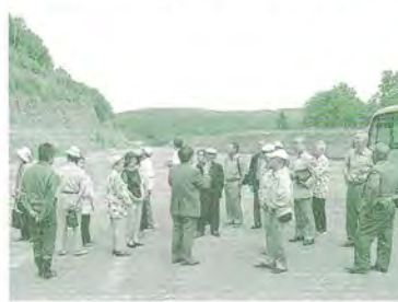
H17.7.14 町連保健衛生部視察研修(有明産廃取り下げ地)