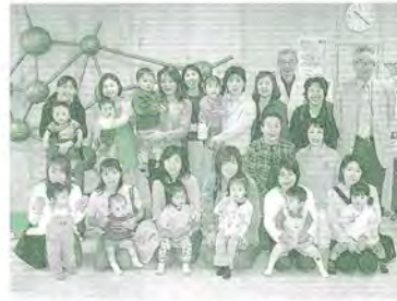
H17.7.6 福まち「こがもちゃん」バス見学(川下公園)