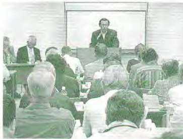
H17.7.26 町連防災防犯講習会