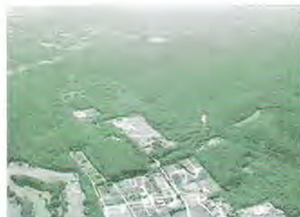
上空からの白旗山競技場周辺

私たちにとって当たり前のようにそこにある白旗山の自然は、世界に誇るべき貴重な財産です。この一番近くにあるすばらしい自然とふれあいながら、地元パワーで守り、育て、未来へ引き継いで行きましょう!