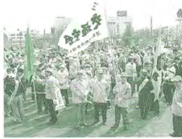
町連交通安全街頭啓発(4,7,9,11月)