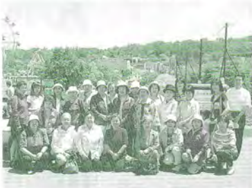
H17.6.28 町連女性部視察研修(旭山動物園)