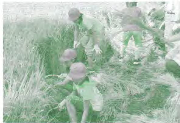
清田区長も校長先生も一緒に稲刈りを体験