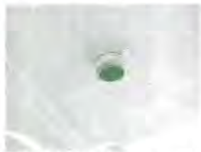
取り外し(ストレーナー部)