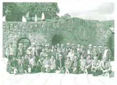
H17.9.27 福まち・民児協合同研修(芸術の森)