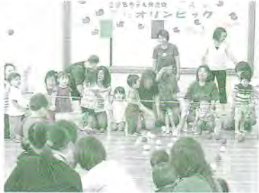
H17.9.21 福まち「こがもちゃん」ミニオリンピック