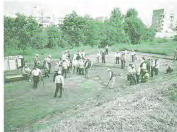
H17.6.26 町連パークゴルフ大会