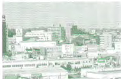
清田1条1丁目付近と水害に見舞われた昭和39年当時の水田地帯