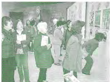
H17.10.17 町連女性部市民見学会(パルライス工場)