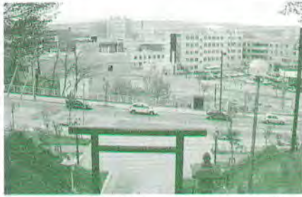
厚別神社から見た区役所周辺と、水田地帯だった昭和35年当時の中心部

昔の写真は、清田ふれあいカレンダーに掲載された「昔の清田の写真大募集」応募写真の中から、清田区役所および写真所有者のご了解を得て転載いたしました。 (清水証明)