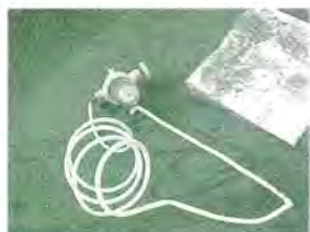
取り外されたストレーナー部分の破損状況

「ホームタンク安全基準検討会」が発足、その答申を受けて十月一日「札幌市ホームタンク技術基準」が施行されました。これは十月一日以後の設置