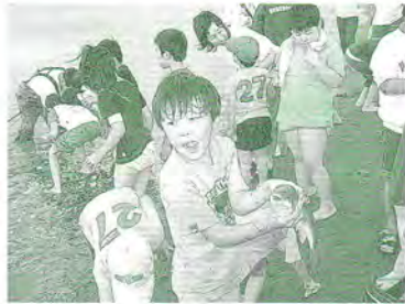
H17.8.2 町連親子見学会(石狩浜で地引網)

友愛訪問(ひとり暮らしのお年寄りへ手作り弁当を持参) お楽しみ会(子育て中の「こがもちゃん」とお年寄りの交流会) ほほえみ交流会 (昼食交流会・ゲームなど)