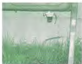
折損箇所(器具で切断)

に義務づけられ、それ以前のホームタンクには指導項目とされず。しかし被害にあつてからで