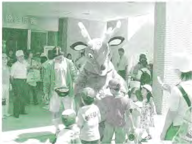
ノルッキーもPRに役 (7/23区民まつり)