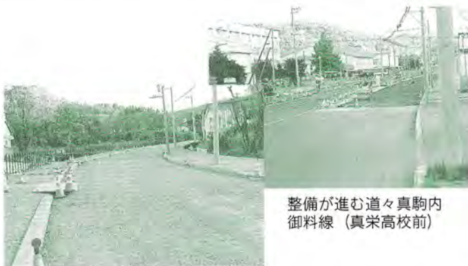
整備が進む道々真駒内御料線(真栄高校前)