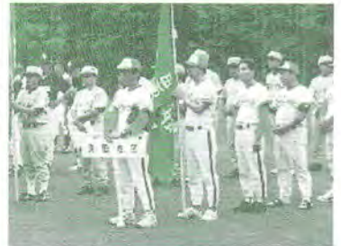
H17.8.21 壮年野球大会(準優勝)