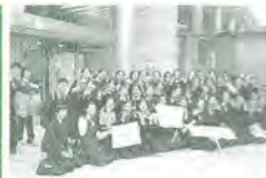
受賞後の記念写真